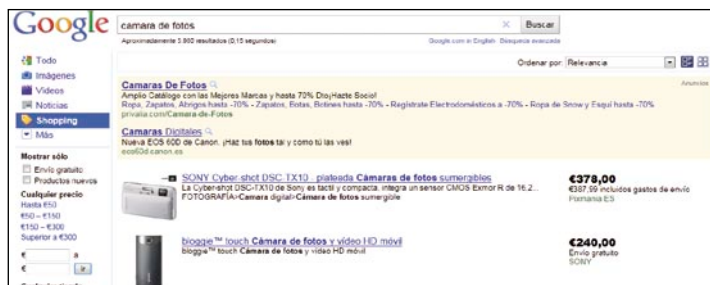
Google Shopping muestra fotos de productos, su precio y descripción y un enlace al sitio web para que el usuario pueda comprarlo.