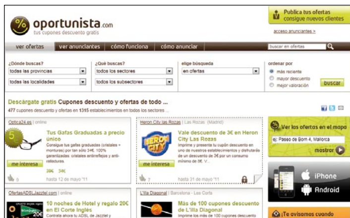
Existen páginas como www.oportunista.com o www.groupalia.es que ofrecen cupones y descuentos en algunos productos y tiendas online.

También se ha valorado el servicio de atención y el soporte técnico.